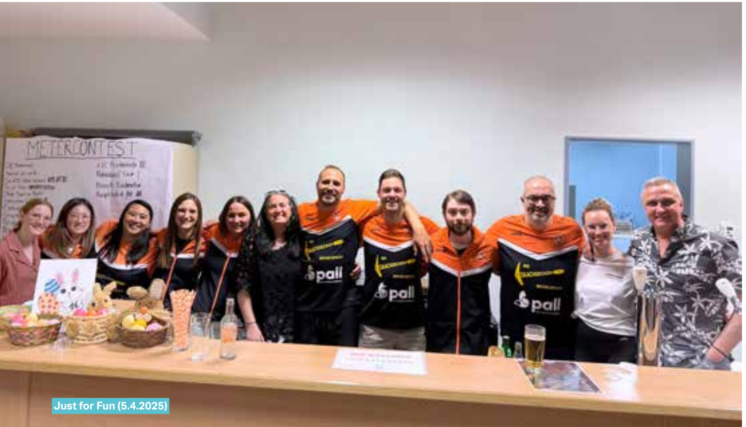
Just for Fun (5.4.2025)

gefollegt vum Spilldag den 22. Mäerz zu Hesper. D'Championnat gött de 17. Mee zu Useldeng an der Hal ofgeschloss. Kommt roueg laanscht, kuckt Iech flott Matcher un a léiert eisen dynamesche Sport kennen!