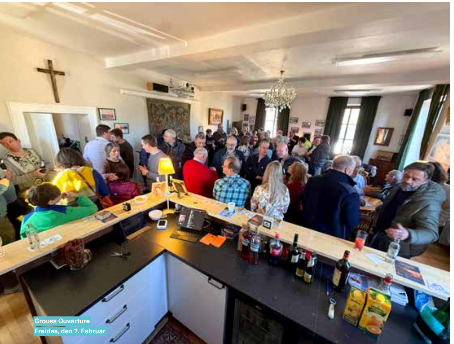
Grouss Ouverture Freides, den 7. Februar