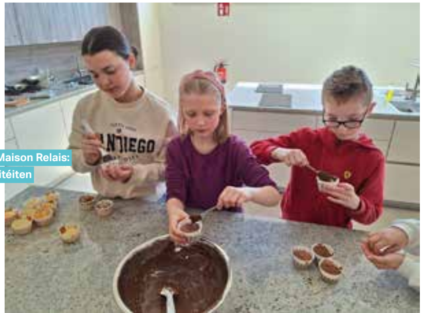
Aus der Maison Relais: Bakaktivitéiten