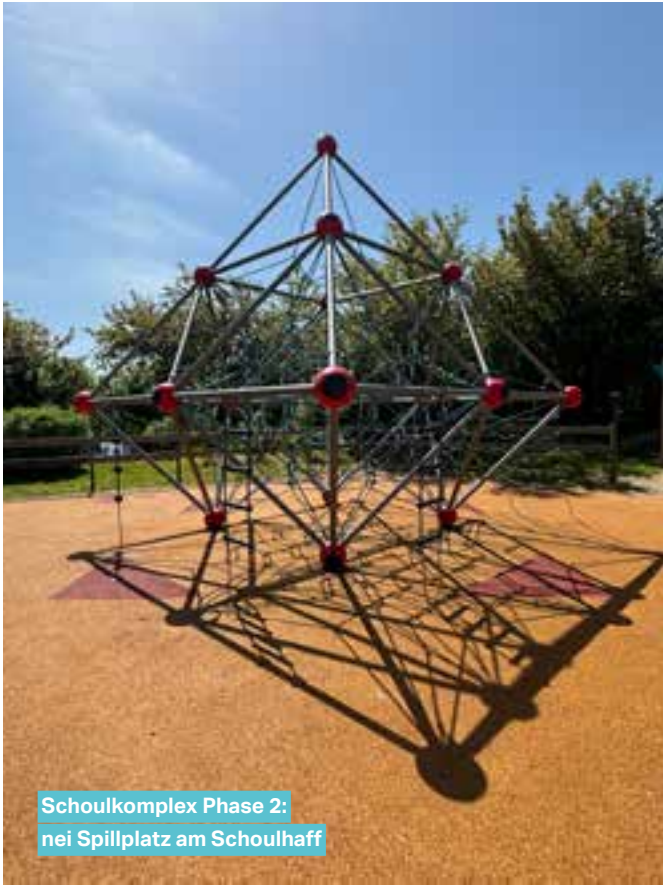
Schoulkomplex Phase 2: nei Spillplatz am Schoulhaff