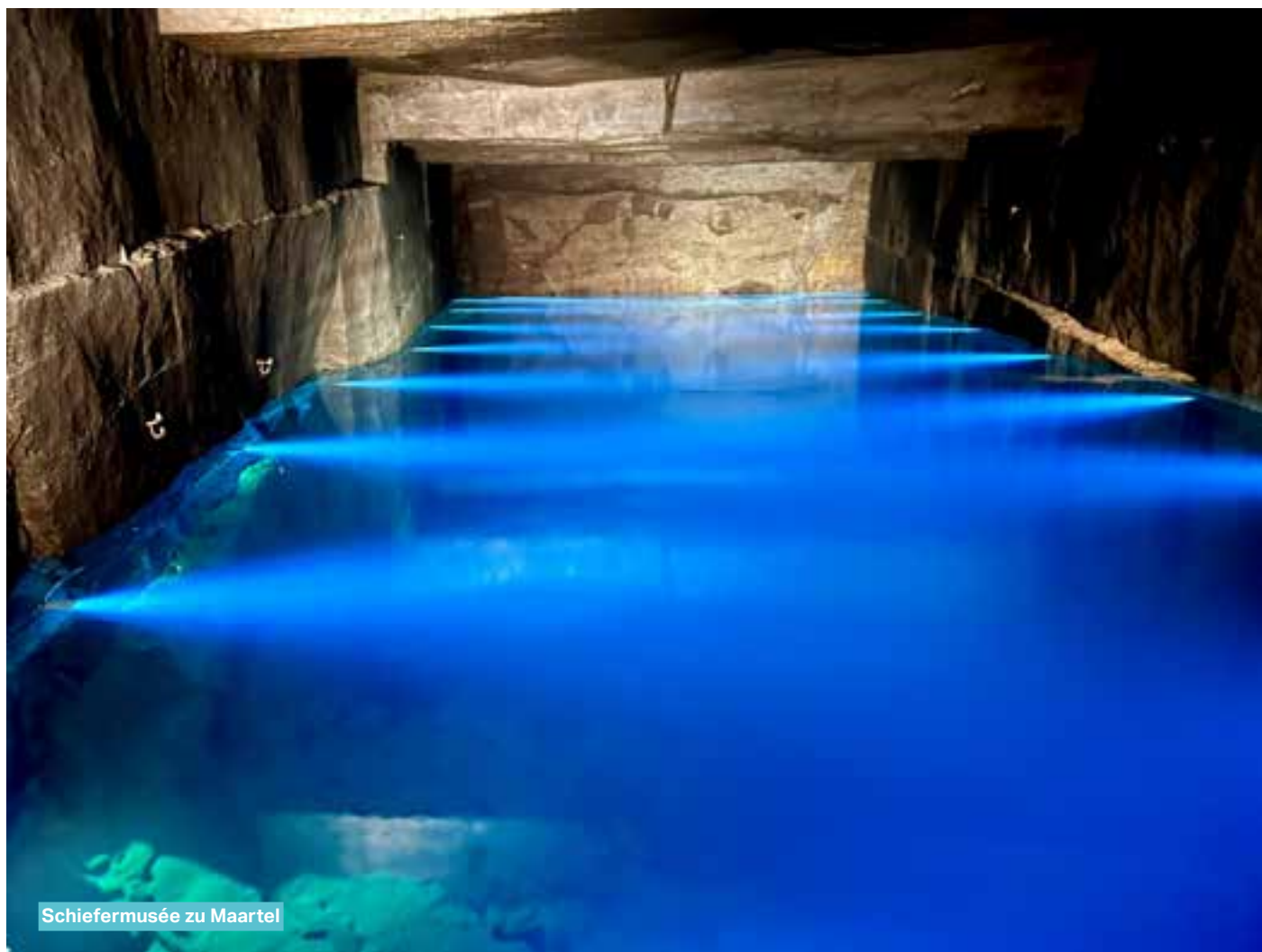
Schiefermusée zu Maartel

D'ASBL Schandeler Duerffrënn ass frou, ee kleng Réckbléck iwwer hir vergaangen Aktivitéiten ze maachen.