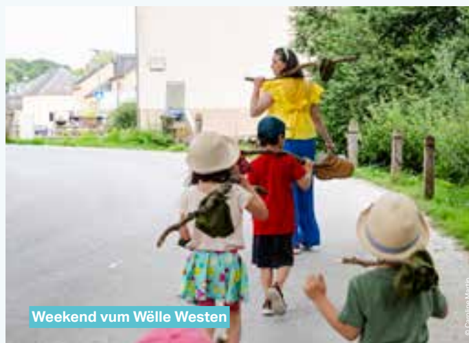
Weekend vum Wëlle Westen