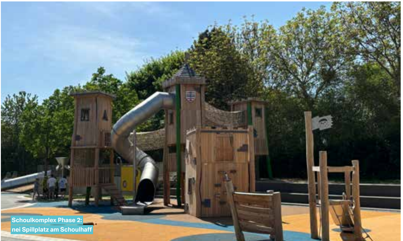
Schoulkomplex Phase 2: nei Spillplatz am Schoulhaff