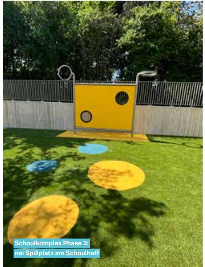
Schoulkomplex Phase 2: nei Spillplatz am Schoulhaff