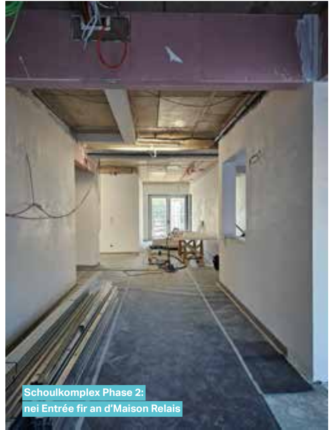
Schoulkomplex Phase 2: nei Entrée fir an d'Maison Relais