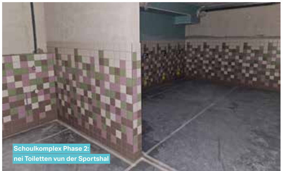
Schoukplex Phase 2: neie Toiletten vun der Sportshal