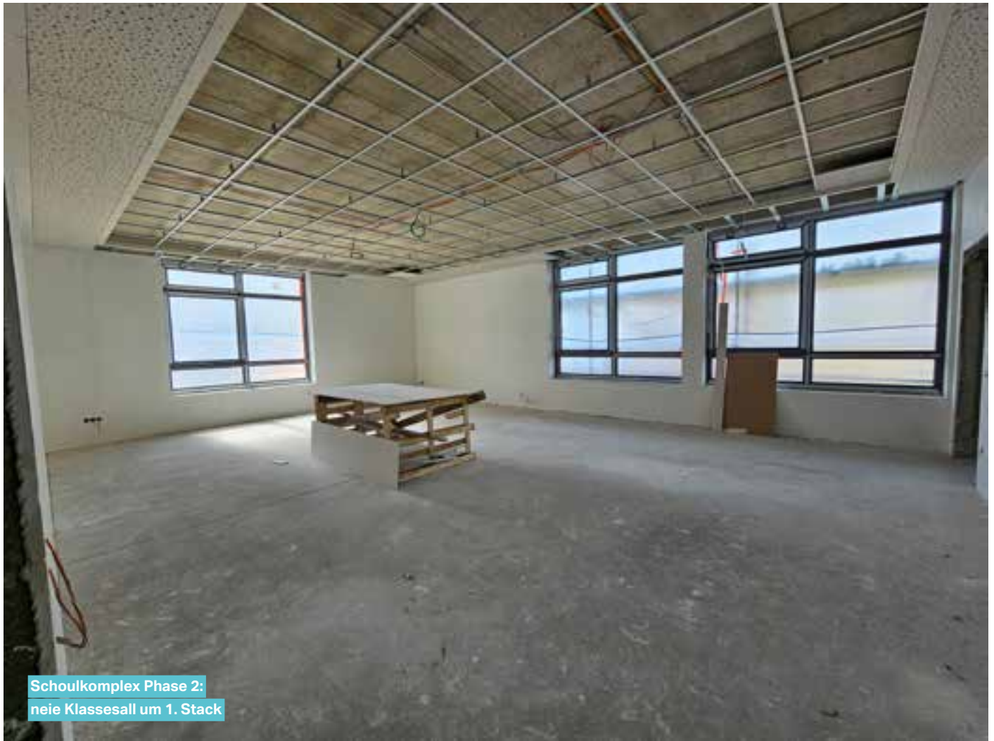
Schoukplex Phase 2: neie Klasesall um 1. Stack