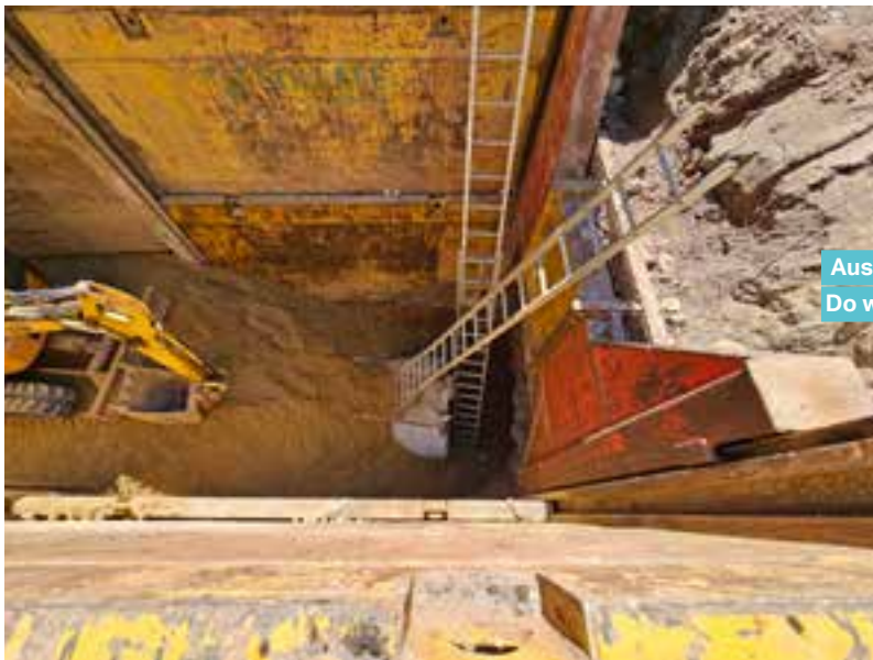
Aus der Gemeng: Do wou geschafft gött