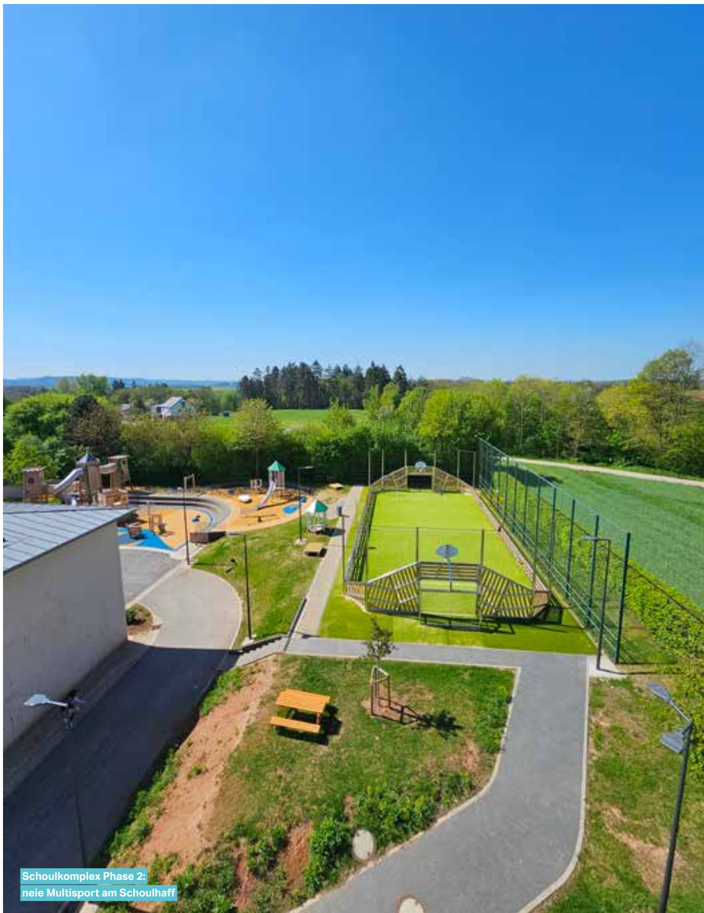
Schoukoplex Phase 2: neie Multisport am Schoukhaff