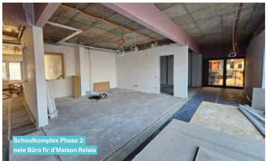
Schoukplex Phase 2: neie Büro fir d'Maison Relais