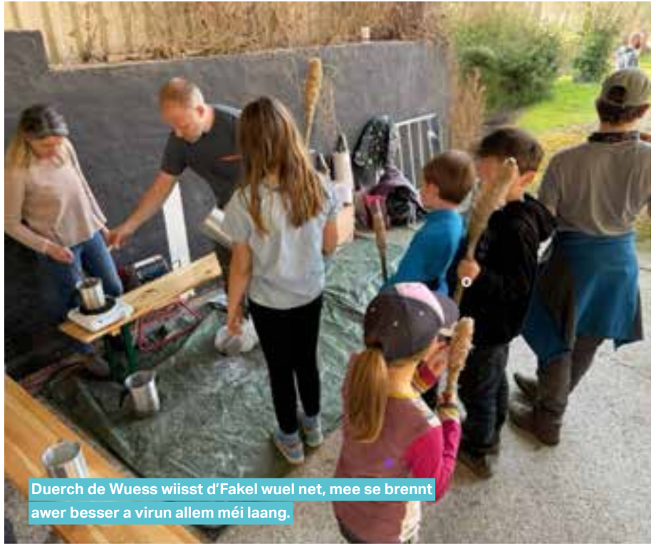
Duerch de Wuess wüsst d'Fakel wuel net, mee se brennt awer besser a virun allem méi laang.

An zu gudder Lescht nach e ganz grouse Merci alle Leit, déi eis ëmmer nees op eis Manifestatiounen ënnerstëtze kommen an un all eis hëllefsbereet Frënn, déi eis, ob am Bistro oder op de Festercher, eng Hand mat upaken. Ouni iech wier dat alles net méiglech!