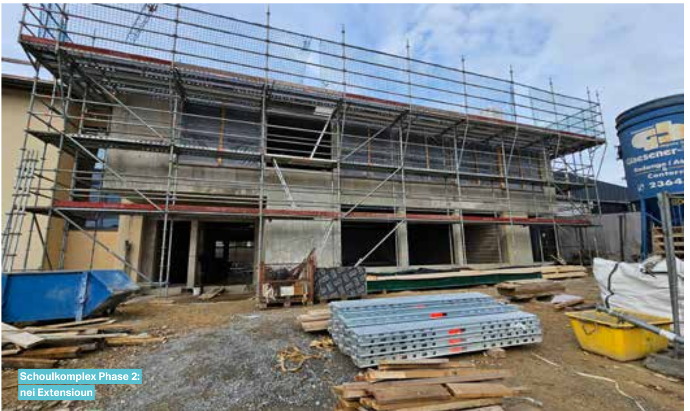
Schoulkomplex Phase 2: nei Extensioun