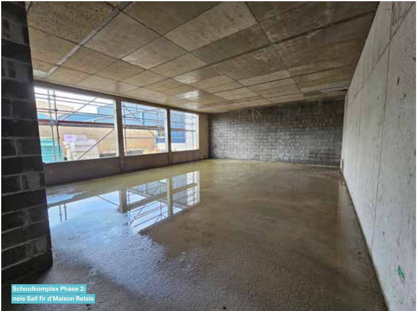
Schoukplex Phase 2: neie Sall fir d'Maison Relais