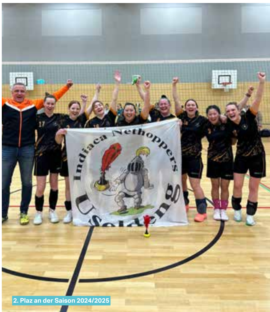
2. Plaz an der Saison 2024/2025

Och dëst Joer ass den Indiaca Nethoppers Useldeng erëm mat dräi motivéierten Ekippen am Championnat an an der Coupe vertrueden.