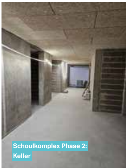
Schoukplex Phase 2: Keller