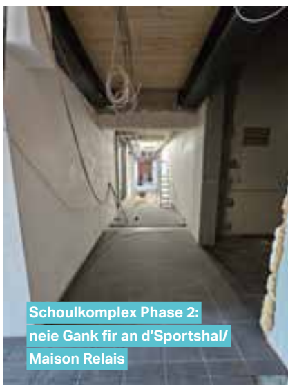
Schoukplex Phase 2: neie Gank fir an d'Sportshal/ Maison Relais