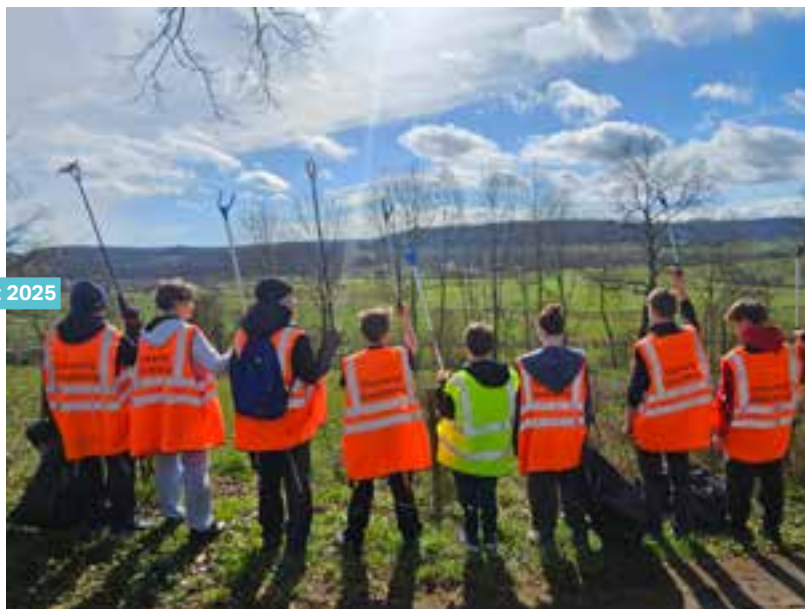
Dat si mir: Grouss Botz 2025