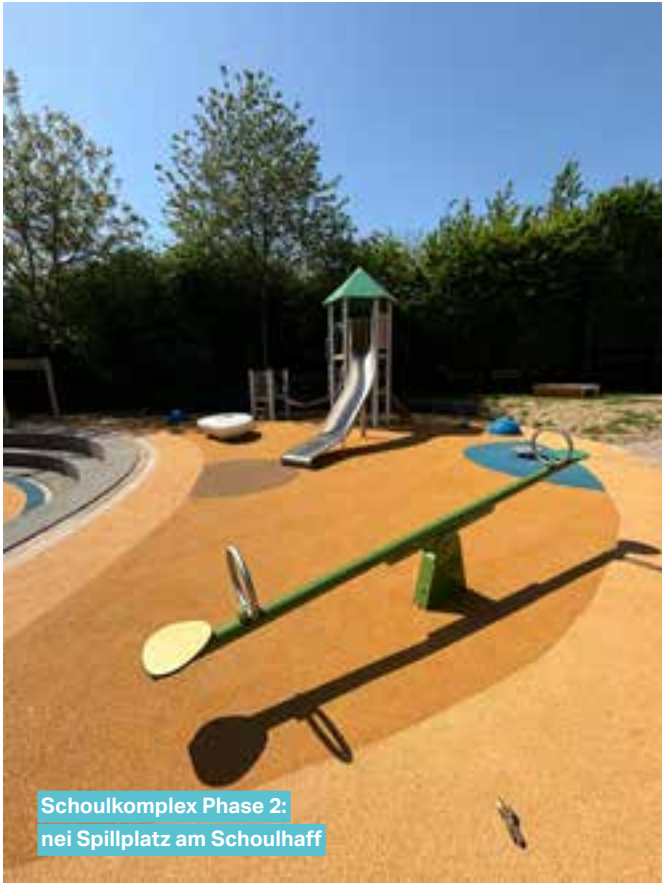
Schoulkomplex Phase 2: nei Spillplatz am Schoulhaff