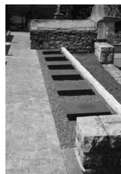
Déi 6 nei Urnegriewer