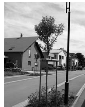
Blummeninsel an der Grottstrooss zu Rippweiler