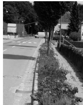
Blummeninsel an der Hauptstrooss zu Iewerleng