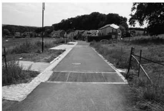
Grill am Feldwee fir d'Reewaasser opzefänken

Am Kader vum Lotissement an der Strooss a Wokelt gouf och hei een Trennsystem agefouert fir d'Waasser wat vun den Aussegebiddere kéint opzefänken an iwwert Réckhaltebasénger an d'Baach, resp. d'Quell ze leeden déi hannert dem Lotissement laanscht leeft. An enger nächster Phase, mam Projet vum Kollekteur lewerleng-Roudbach, gétt dëst Reewaasser duerch eng zousätzlech Kanalisation an der Strooss „a Laichent“ opgefaang an direkt an d'Atert geleed. ■