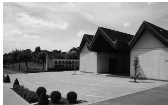
Déi nei gestallte Plaz

Zu lewerleng um neien Deel vum Kierfecht goufe Weeër mat Verbundsteng amenagéiert an et goufen 18 Urne caveauen agesat. Heivunner goufen der 6 Stéck schonn als Urnegraf fäerdeg gemeet. Dës Urnegriewer stellen eng nei Form duer fir déi Urnemaieren wéi se z.B. op dem Useldenger a Schandeler Kierfecht stinn ze ersetzen. Duerch dës Form vun Urnegriewer sollen d'Leit méi Intimitéit hunn fir un hir verstuerwe Leit ze denken. →