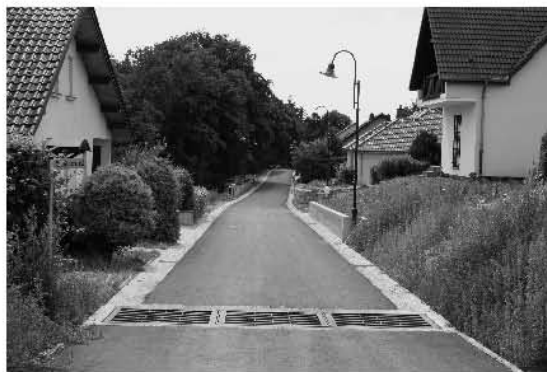
Grill an der Strooss fir op Schandel

Am Kader vum Lotissement an der Strooss a Wokelt gouf och hei een Trennsystem agefouert fir d'Waasser wat vun den Aussegebiddere kéint opzefänken an iwwert Réckhaltebasénger an d'Baach, resp. d'Quell ze leeden déi hannert dem Lotissement laanscht leeft. An enger nächster Phase, mam Projet vum Kollekteur lewerleng-Roudbach, gétt dëst Reewaasser duerch eng zousätzlech Kanalisation an der Strooss „a Laichent“ opgefaang an direkt an d'Atert geleed. ■