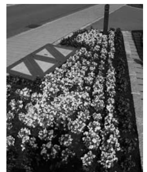
Blummeninsel an der Schandeler Strooss zu Useldeng