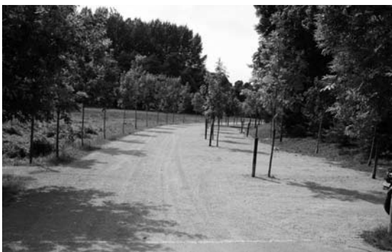
Den Öko-Parking an der lewerlenger Strooss

Fir de Problem ze léise mat dem Bulli un de Féiss wann et reent um Öko-Parking zu Useldeng an der lewerlenger Strooss huet d'Gemeng déi ierwecht Couche Sand ofgedeckt an de Parking mat engem 2/8 Edelsplitt nei iwwerzunn. Mir hoffen datt mer de Problem domatt geléist hunn.