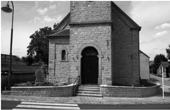
Déi nei Mauer bei der Kierch zu Rippweiler

D'Mauer virun der Kierch zu Rippweiler gouf erneiert. Den Talus niewt der Kierch gëtt nach am Hierscht ugeplazt a soll doduerch den Duerfkär vu Rippweiler verschéineren.