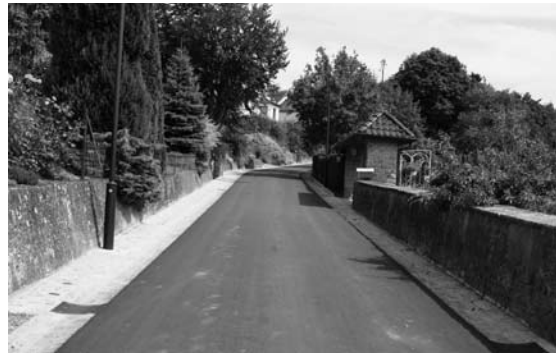
Déi nei Schandelerstrooss

Desweideregouf zu lewerleng d'Strooss Schamicht komplett erneiert an a Wokelt gouf de Stroossebelag nei gemeet.