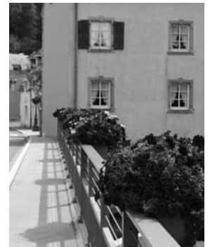
Blummen op der Bréck zu Useldeng