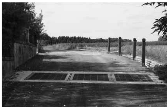
Grill a Gruef laanscht de Feldwee dee bei déi al Antenne féiert

Zu lewerleng an der Schandelerstrooss gouf och eng Reewaasserkanalisation matverluecht fir d'Leit virun den Iwwerschwemmungen ze schützen.