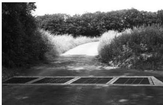
Grill am Feldwee um Flouer genannt „Bei den Wetzzenbäumen“

Zu lewerleng an der Schandelerstrooss gouf och eng Reewaasserkanalisation matverluecht fir d'Leit virun den Iwwerschwemmungen ze schützen.