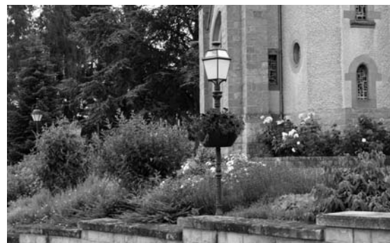
Plaz virun der Kiirch zu Useldeng