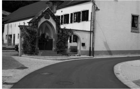
Schandelerstrooss mat Bléck op den Haff Schmit a Kapell

Vum leschte Joer Métt Mee un bis dëst Joer de Summercongé gouf zu lewerleng an der Schandelerstrooss vun der Firma Tragec geschafft. Obwuel dës Chantier am Virfeld als méi schwierig ugesi ginn ass wéint der schmueler Strooss etc. ass wéinst dem Verständnis vun de Leit aus der Strooss an deem gudden Schaffe vun der Firma dës Chantier ouni gréisser Problemer iwwert d'Bühn gaang. Merci nach eng Kéier vun hei aus de Leit fir hiert Verständnis an déi gudd Zesummenaarbecht.