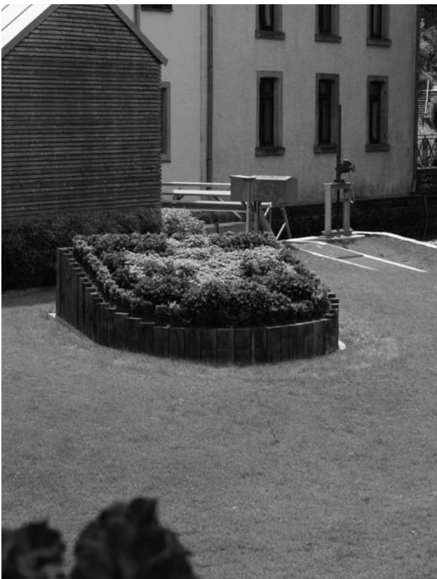
Deen neie Wopen vun der Gemeng um „Wertchen“

Fir zur Verschéinerung vun eisen Dierfer bäizedroen hunn d'Gemengenaarbechter am Fréijor fläisseg gegäertnert an nit manner wéi 2.653 Blummeplanze gesat an 1.541 Beem, Hecken-, Stauden- a Rouseplanze verschafft. →