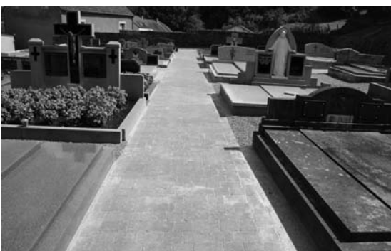
Den Haaptwee um neie Kierfecht