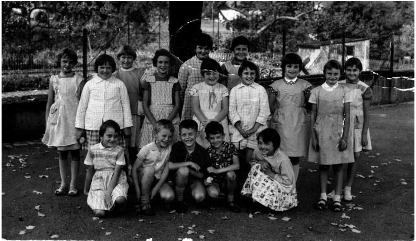
Foto vu fréier