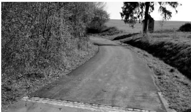
Bei der Kapell

De Wanter iwwer gouf an der Gemeng vill un de Feldweeër geschafft. Ënner anerem gouf de Wee am Hiesel bei der Kapell erneiert, zesumme mat der Viichtener Gemeng gouf de Feldwee „Heed“ fir op Béiwen nei geteert an zesumme mat der Préizerdauler a Grousbouser Gemeng gouf de Feldwee vu Schandel op Grousbous nei gemeet. Deemächst soll elo nach de Wee „Diesgröndchen“, wou een nationalen Spazierwee driwwer geet, erneiert ginn.