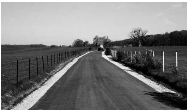
Schandel op Grousbous