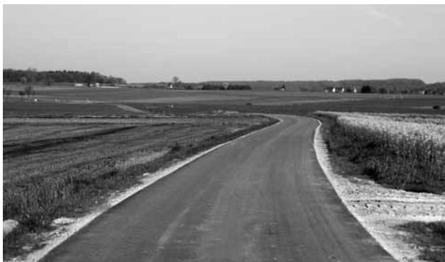
„Heed“ Richtung Béiwen