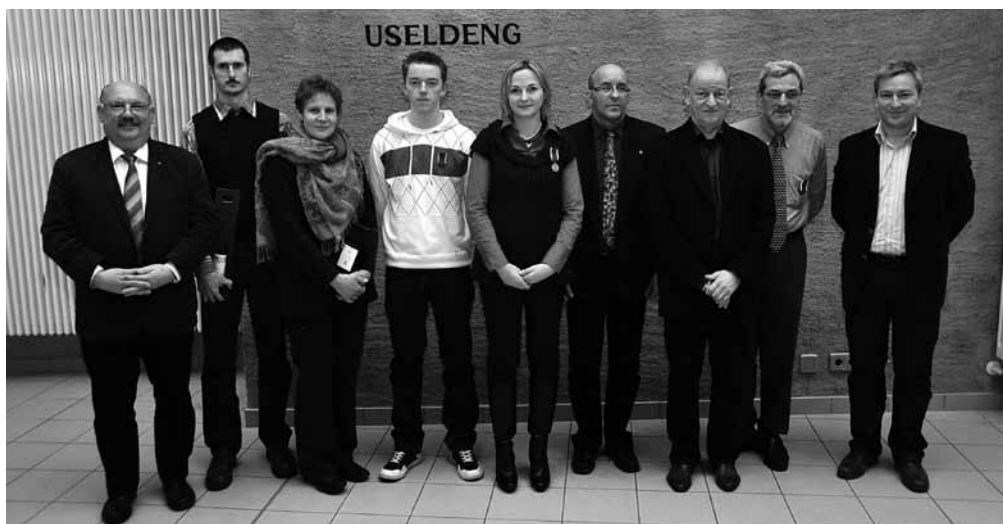
Anlässlich der Jahreshauptversammlung der Harmonie Useldingen wurden verdienstvolle Musikanten mit UGDA-Medailles ausgezeichnet.