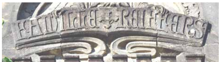
Detail Mausoleum 29