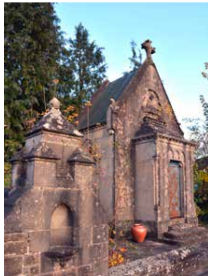
Mausoleum der Familie Reiffers auf dem Useldinger Friedhof 29

Das großzügig gestaltete Mausoleum der Familie Reiffers drückt dem im Jahre 1906 in Useldingen neu angelegten Friedhof unweigerlich seinen Stempel auf. Einige schöne Elemente des Jugendstils vermögen das ansonsten strenge Bauwerk aufzulockern.