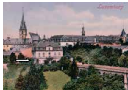
Die Villa Reiffers am Boulevard du Viaduc, heute Boulevard Roosevelt 29

Am 29. Mai 1929 erwarb er in Luxemburg-Stadt die sehr schön am heutigen Boulevard Roosevelt n°16 (ehemals Boulevard du Viaduc) gelegene Villa, die seit Juli 1955 die Residenz der britischen Botschaft beherbergt 21 .