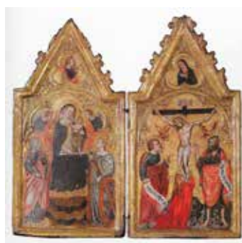
Dyptychon – Giovanni di Paolo Fei (1345-1411 Sienna)