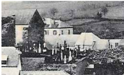
Die Villa ohne Turmanbau – circa 1905 – vorne rechts der Schuttberg der abgetragenen früheren Useldinger Dorfkirche 29 .