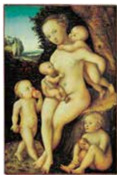
La Charité von Lucas Cranach der Ältere oder der Jüngere