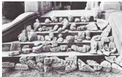
Die in Akscht aufgefundenen römischen Fragmente aufgereiht vor der Villa Reiffers in Useldingen (ein Foto von dreien) 10 .

In den frühen zwanziger Jahren, als der barocke Hauptaltar aus der ehemaligen Useldinger Dorfkirche dem Kunstempfinden der Useldinger Dorfväter und Kirchgängern nicht mehr gerecht wurde, bot sich Edmond Reiffers an, die Finanzierung eines neuen kunstvollen Flügelaltars für die heutige Dorfkirche auf seine Kosten zu übernehmen. Die Kunstschreinerei Jungblut aus Remich wurde mit der Anfertigung des Altares beauftragt. Dieser künstlerisch wertvolle Altar befindet sich auch heute noch an seinem angestammten Platz. Als Gegenleistung erhielt Reiffers zwei antike Säulen und einen Fries, die aus