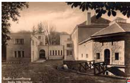
Die Villa Louvigny in den Anfangsjahren von RTL 28

Am 10. Juni 1926 wurde Edmond Reiffers Eigentümer der symbolträchtigen Villa Louvigny in Luxemburg-Stadt 18 . Der zu zahlende Preis belief sich auf 950.000 Luxemburger Franken. Im Jahre 1931 wurden einige Räume in der Villa Louvigny als Sendestudios und Aufnahmestudios umgebaut und von der im selben Jahre gegründeten Compagnie Luxembourgaise de Radiodiffusion (CLR) angemietet. Edmond Reiffers war als Aktionär an der Kapitalbildung beteiligt, wenn wohl auch nur symbolisch. Am 29. Juni 1937 verkaufte Edmond Reiffers die Villa Louvigny zum Preis von 3.500.000 Franken an die CLR.