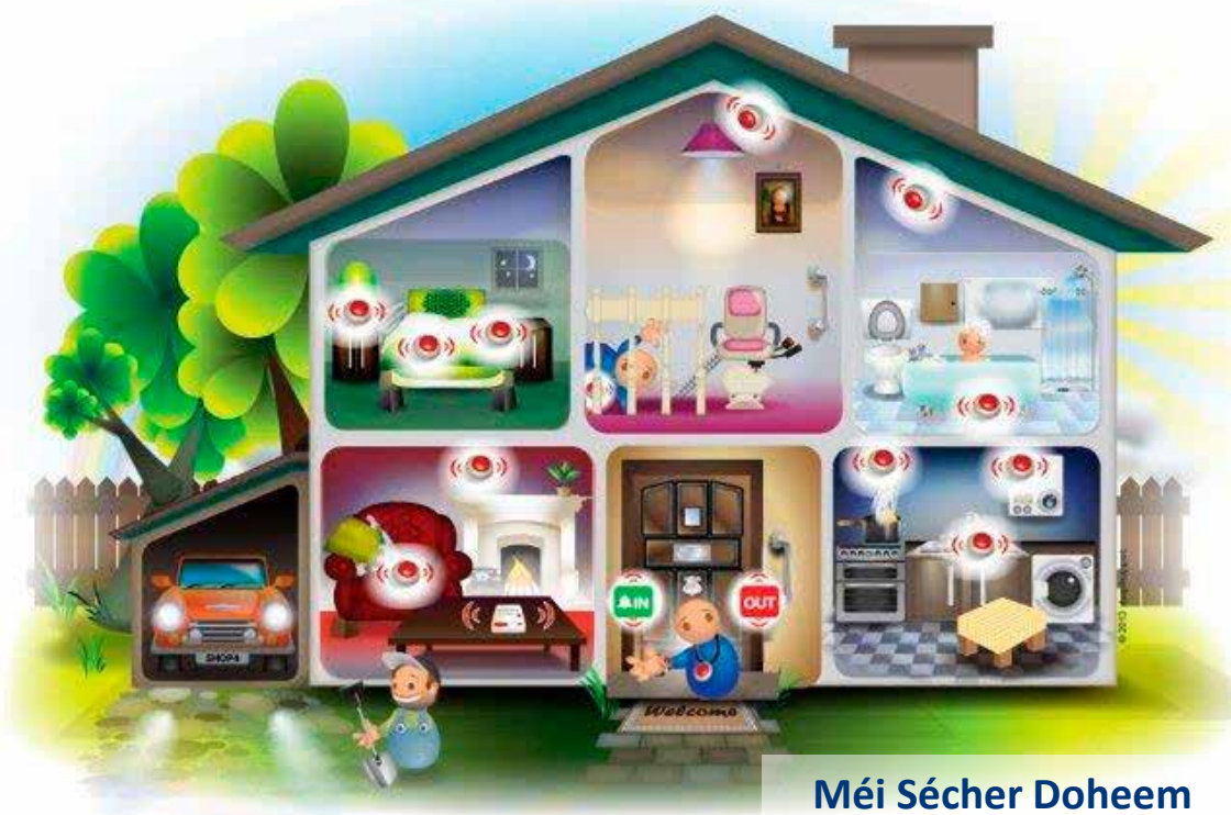
Méi Sécher Doheem