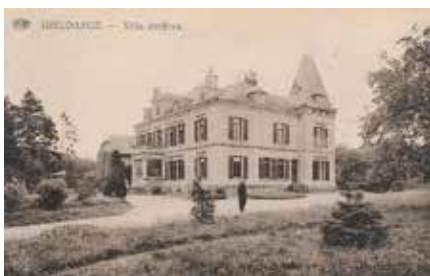
Die Villa Reiffers vor 1940 – Der Turm gehörte nicht zum ursprünglichen Bauwerk und wurde wohl nachträglich von der Familie Reiffers angefügt 29 .