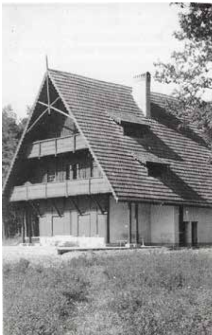
Das Chalet in Akscht (Vichten) 11

In Akscht, zwischen Vichten und Schandel gelegen, wo Reiffers etwa 15 ha Land und 20 ha Wald sein eigen nannte, liess er sich im Jahre 1918 ein geräumiges Jagdchalet erbauen. Das Chalet brannte zweimal ab und ist heute nicht mehr erhalten. Bei den Bauarbeiten stieß man auf Fragmente von römischen Steinen und Skulpturen. Die mehr als tausend Teile ließ Reiffers nach Useldingen bringen, wo er sie auf den zu seiner Villa führenden Treppenstufen ablichten ließ. Die Fotos sind uns erhalten geblieben 10 . Die archäologischen Fundstücke verkaufte er während des Zweiten Weltkrieges (1943) an das Landesmuseum in Luxemburg Stadt. Unbestätigten Gerüchten zufolge 11 waren im Jahre 1919 in diesem Chalet die letzte österreichische Kaiserin Zita mit ihren Kindern, unter anderem Otto von Habsburg, für kurze Zeit untergebracht. Kaiserin Zita, Schwester von Prinz Felix, dem Gemahl von Großherzogin Charlotte, war zu dieser Zeit mit ihrer Familie auf der Flucht ins Exil.