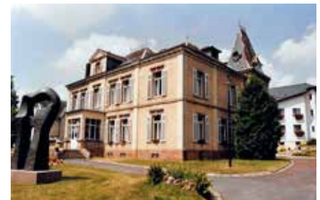
Die Villa Reiffers in den 90er Jahren 29