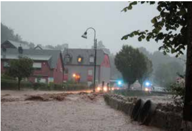
Rue Principale (op der Kräizung mat der Strooss „A Laichent“)

Nodeems an deene leschte Joren massiv an den Héichwaasserschutz zu Iewerleng investéiert ginn ass, hu mer leider d'lescht Joer, den 9. Juni misste feststellen, datt déi realiséiert Moossname bei engem extreme Reen (op der Miesstatioun Räichel goufe 60 l/m 2 an 2 Stonne gemooss) d'Iwerschwemmungen nit verhënnere konnten.