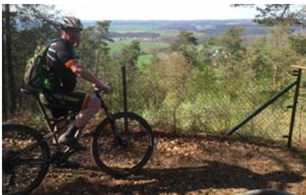
Bei der Suche nach neuen Strecken für den Castleride 2019.

Unser Castleride-Treff erwacht so langsam aus dem Winterschlaf! Nach und nach kommen Verletzte und Urlauber wieder zurück!