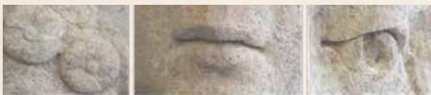
Details: Kopfschmuck, Mund und rechtes Auge