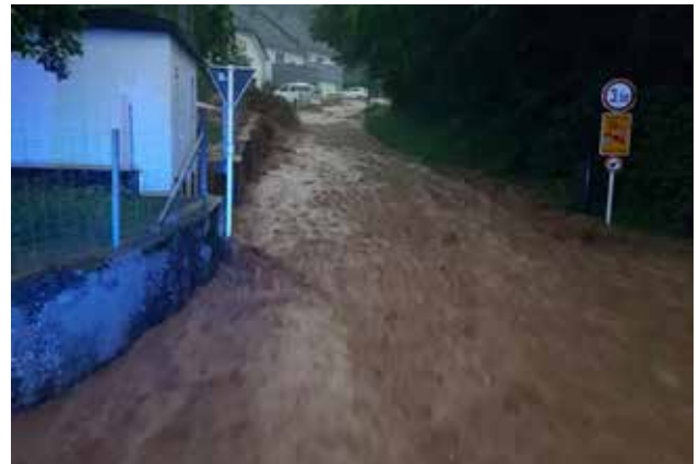
Rue Hiel (op der Kräizung mat der Strooss „rue de Schandel“)

Dës Etüd gëtt an zwou Phasen opgedeelt. An enger éischter Phas gëtt eng Bestandsopnam an eng Analyse vun der bestehender Infrastruktur, de realiséierte Moossnamen a vun den ertleche Gegebenheeten duerchgefouert. An enger zweeter Phas soll an Hand vun hydraulische Modeller analyséiert ginn, wei eng konkret Moossname kenne realiséiert ginn.