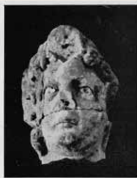
Gl. de M. J.-B. Sibener. 0,4000, 0,0020

In seinem 1905 erschienenen Guide illustré du Musée lapidaire-Romain d'Arlon 7) , beschreibt J.-B. Sibener unter der Nummer 53 den skulptierten Kopf und bestätigt nochmals seinen römischen Ursprung. Er neigt aber doch der Interpretation zu, dass der mittlerweile notdürftig ausgebesserte Kopf zu einer Pomona, römische Göttin der Baumfrüchte, gehören könnte.