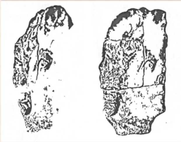
Zeichnung von 1913 aus dem Recueil von Espérandieu 8)

Im Jahre 1937, nach dem Umzug des archäologischen Museums von Arlon in neue Räumlichkeiten, veröffentlichte Professor Alfred Bertrang 9) in einem Inventar unter anderem die römischen Exponate, die in der Reserve des Museums im Hinterhof abgestellt waren. Unter der Nummer 11. figuriert unser Kopf – in vier Fragmenten (ohne Bild). Neue Erkenntnisse werden nicht angeführt.