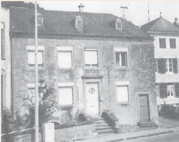
In diesem Haus in der Gran-rue N°18 entstand das Lied "Un der Atert" (und nicht, wie manche glauben, in der Villa Bian. Diese wurde erst 1947, zwei Jahre nach J.-P. Welters Tod, von Notar Faber an Dr. Zoller verkauft.)