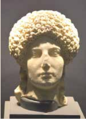
Kopf aus Boevingen/Attert (weißer carrarischer Marmor)

Geburt) zurück und wurde in der ersten Hälfte des 19. Jahrhunderts in Boevingen/Attert in einem Brunnen-schachte aufgefunden. Eine andere Interpretation geht in Richtung der Darstellung eines Dieners. Der Kopf stammt aus dem Besitz von Gaspard Théodore Ignace de la Fontaine (1787-1871), Gouverneur des Grossherzogtums, der ihn im Jahre 1867 dem Archäologischen Institut in Arlon schenkte 12) .