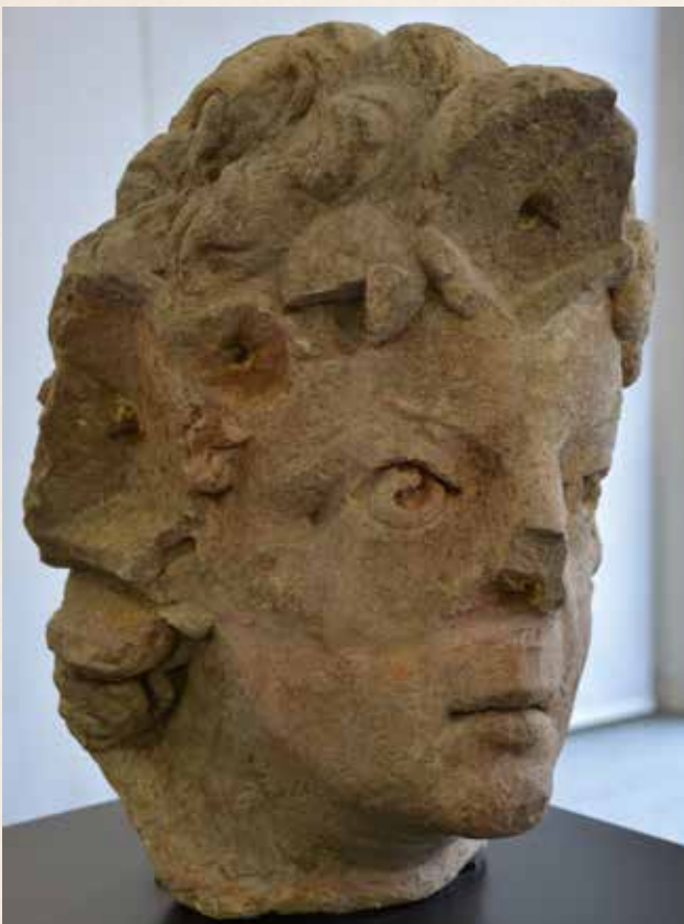
Der Bacchus-Kopf im April 2019

Also lohnt sich ein Besuch dieses ansprechenden Museums, Bacchus wird Sie mit einem schelmischen Augenzwinkern begrüßen!