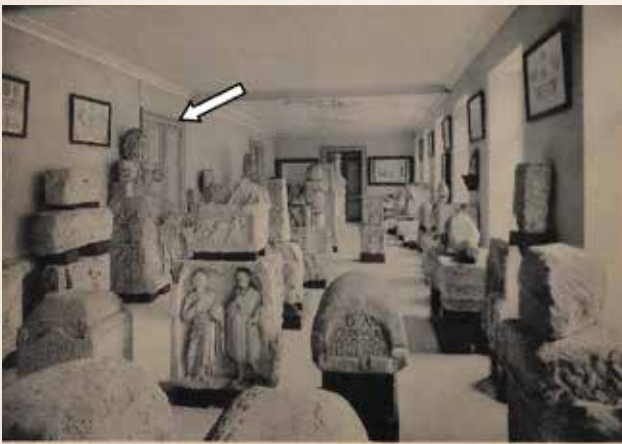
Nels Postkarte aus den 1930er Jahren. Archäologisches Museum in Arlon. Der Bacchus-Kopf, siehe Pfeil (Collect. GM)

Im Jahre 1937, nach dem Umzug des archäologischen Museums von Arlon in neue Räumlichkeiten, veröffentlichte Professor Alfred Bertrang 9) in einem Inventar unter anderem die römischen Exponate, die in der Reserve des Museums im Hinterhof abgestellt waren. Unter der Nummer 11. figuriert unser Kopf – in vier Fragmenten (ohne Bild). Neue Erkenntnisse werden nicht angeführt.