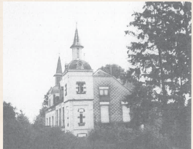
Die Villa Lamborelle in der Grand-rue N°11. Hier begegneten sich Theriente und Major Walli.

Tochter bewusst ertrinken, weil er ihr schon lange überdrüssig war („Wëll ech d'Waasser scheien, loossen ech leien d'Josefinn“). Dieser zynische Schlusssatz provoziert jedoch keineswegs Entrüstung, sondern lediglich Schmunzeln beim Zuhörer, da dieser erkannt hat, dass durch den ganzen Text ein humorvoll-spöttischer Nebenton anklingt. Dieses war übrigens schon im Original der Fall, obschon hier ein gewisses Bedauern über den Tod der Tochter angedeutet wird.